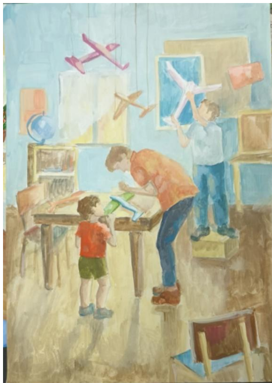
Кунаккильдина Амилия Мы с папой! 2024г.