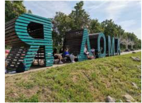
Пленэр на набережной реки Миасс, 2024 год