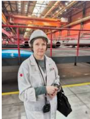
Индустриальный пленэр на ЧТПЗ Высота 239, 24.03.2025 год