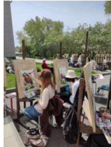
Посещение мастер-классов, 2023, 2024 годы