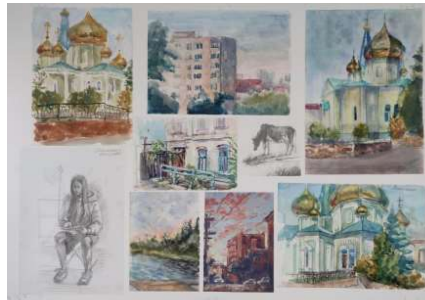
Пленэрные и летние домашние работы учащихся 4 класса, 2024 год