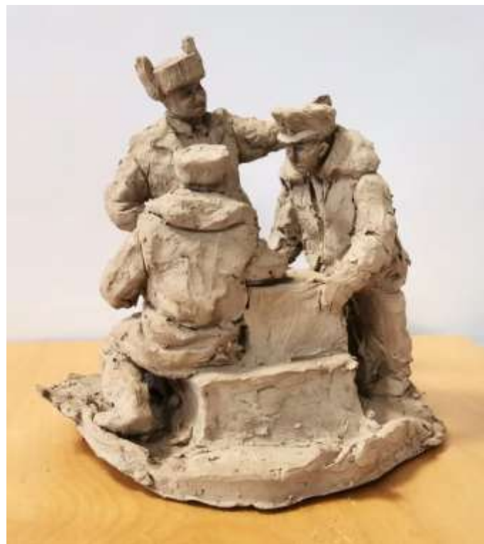
Зеленских Елизавета, 14 лет, 4 класс Северная экспедиция глина, 2024 год