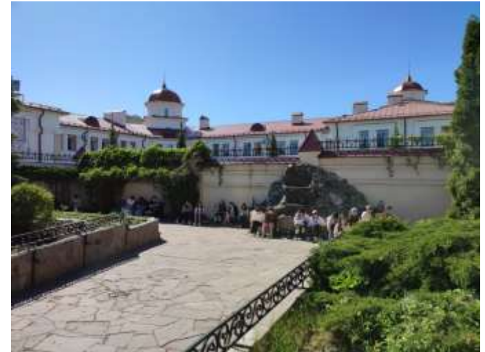
Пленэр на территории Свято-Симеоновского кафедрального собора, 2024, 2025 годы