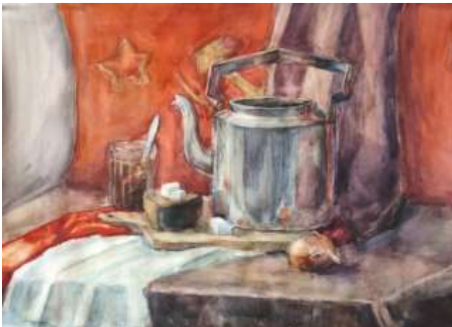
Окс Ксения, 13 лет, 4 класс Военный натюрморт бумага, акварель, А 2, 2024 год