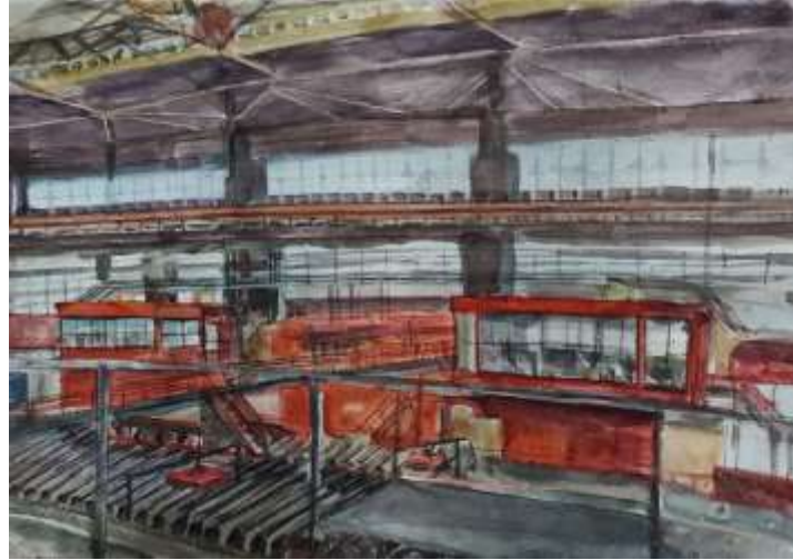
Верхотурцева Таисия, 14 лет, 5 класс ЧТПЗ Высота 239 бумага, акварель, А 3, 2025 год