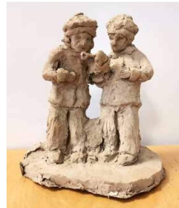
Паносян Изабелла, 16 лет, 4 класс Мыльные пузыри глина, 2024 год