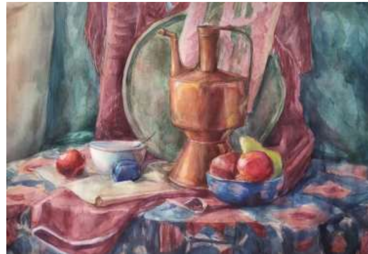
Окс Ксения, 14 лет, 5 класс Восточный натюрморт бумага, акварель, А 2, 2025 год