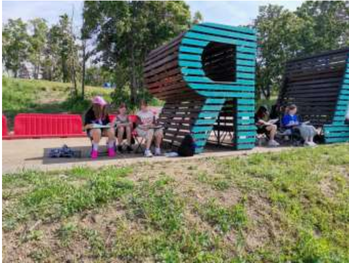
Пленэр на набережной реки Миасс, 2024 год