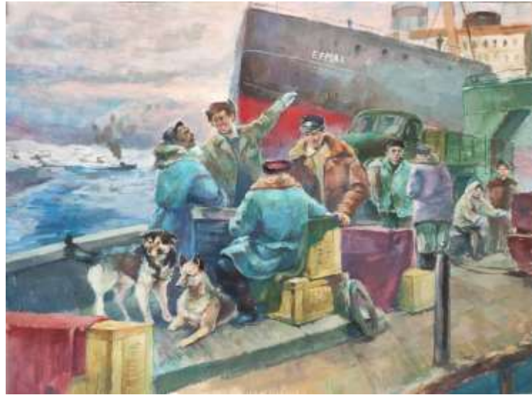
Зеленских Елизавета, 14 лет, 4 класс Северная экспедиция бумага, гуашь, А 2, 2024 год