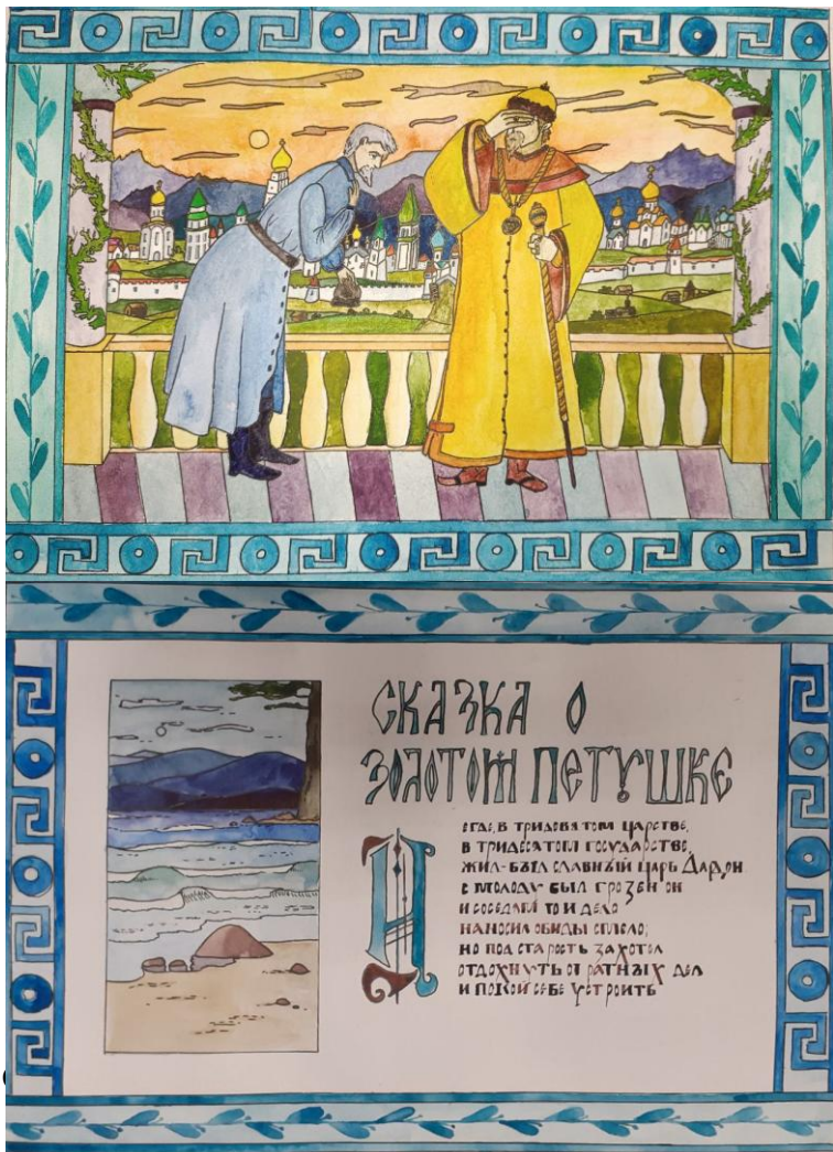
Хрипунов Мирон 13 лет