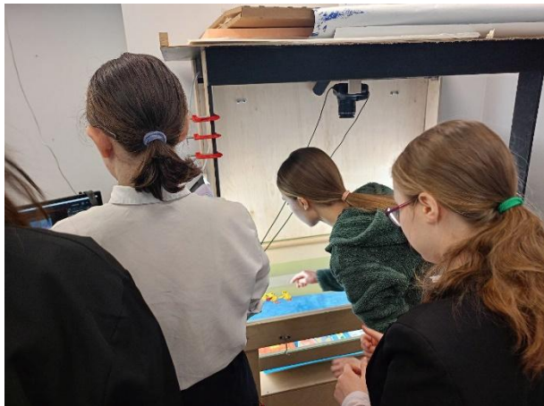
Фото с занятий и мастер-классов: