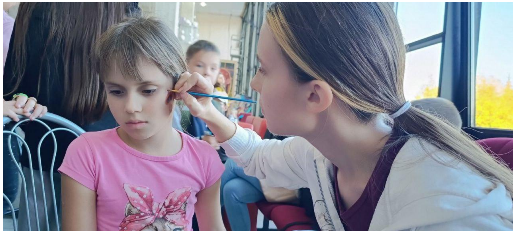
23.09.2024, рисование аквагрима на фестивале «Мульти-Пульти Фест»