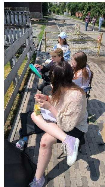
02.06.2025 – 17.06.2025, проведение мастер-классов по пленэру в рамках летнего лагеря ДХШИ «АрхСкворечник»