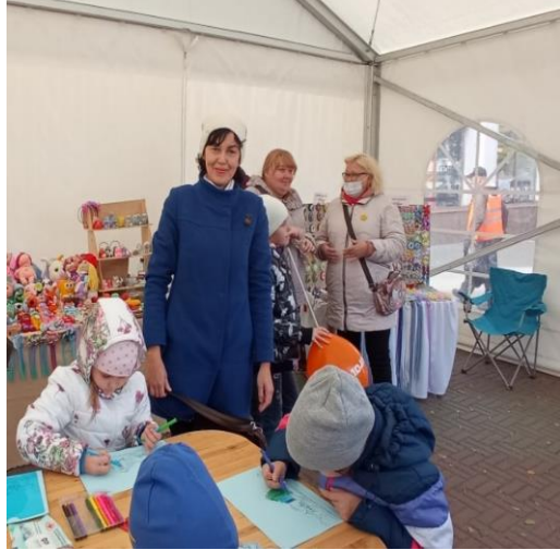
Мастер-класс по изготовлению открытки «Мой Челябинск», 13 сентября 2023 г.