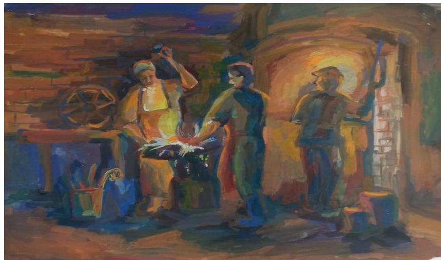
Лапач Мария «В кузнице» гуашь, 40\60, 2021 г.