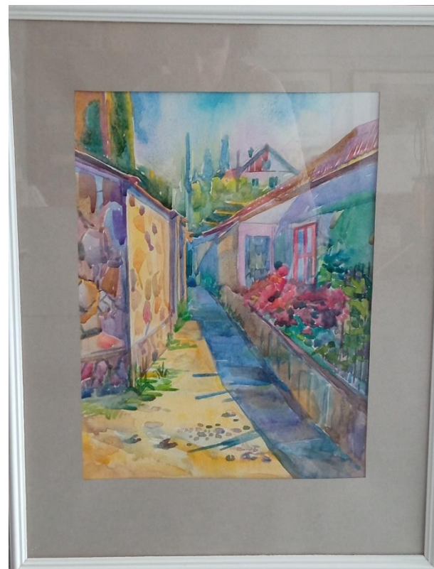
Этюд «Южная улочка» 30\40 акварель 2022 г.