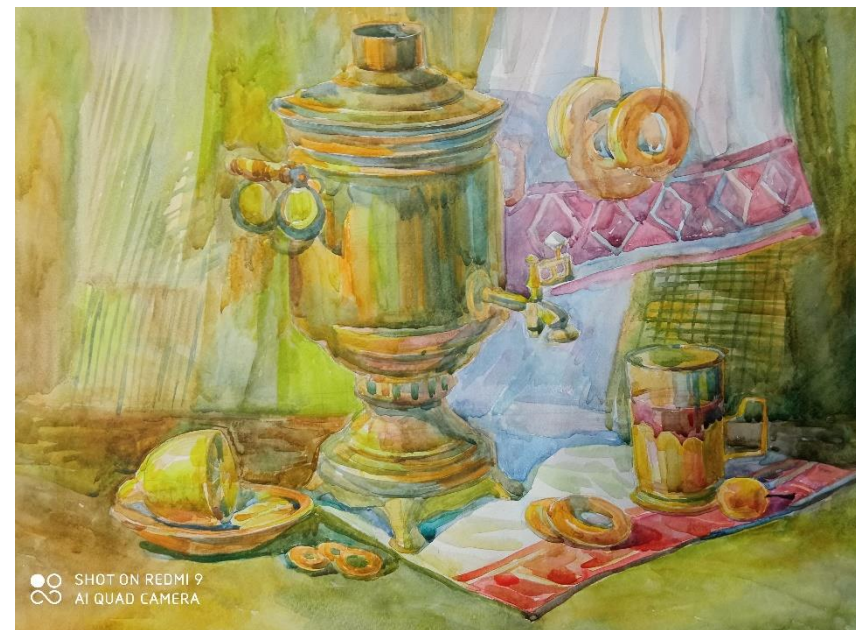
Натюрморт «С самоваром» 40\60 акварель.2023 г.