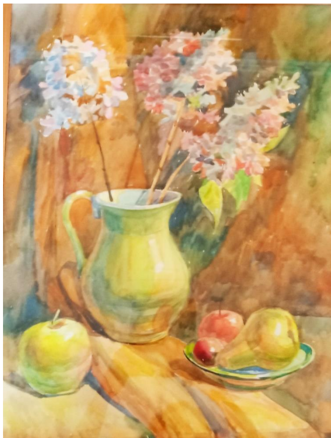
«Натюрморт с ветками гортензии». 50\60 акварель 2021 г.