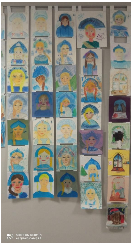
Зимняя выставка работ подготовительного отделения «Снегурочки» 2024 г.