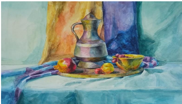
«Тематический натюрморт» Название техника, размер, год создания