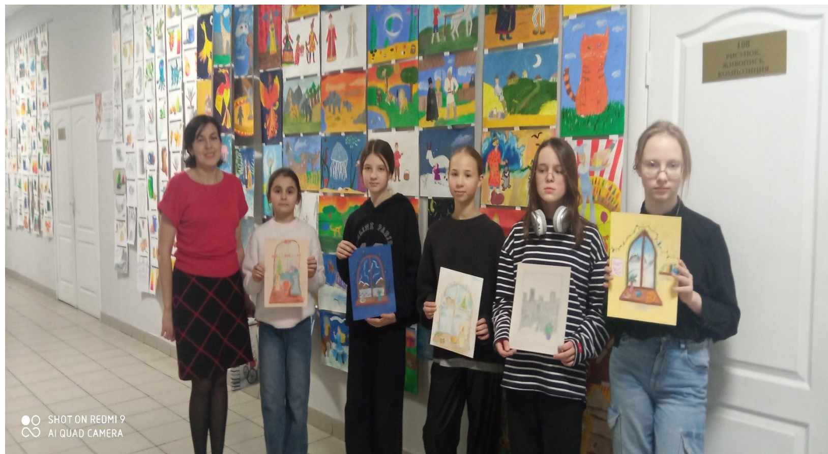
Отчетная выставка работ подготовительного отделения за 1-ое полугодие 2024-25 уч. года