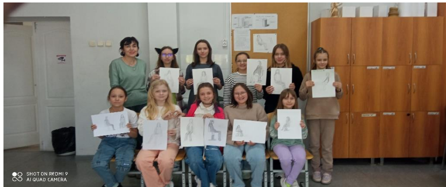
Занятие по рисунку подготовительного отделения, тема «Набросок фигуры человека»