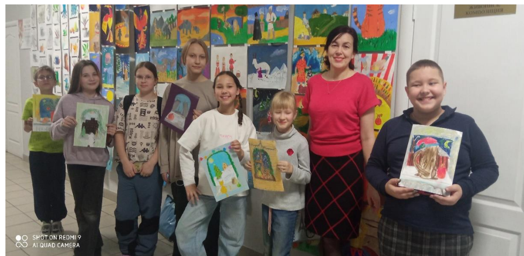
Подготовительное отделение 2024 г.